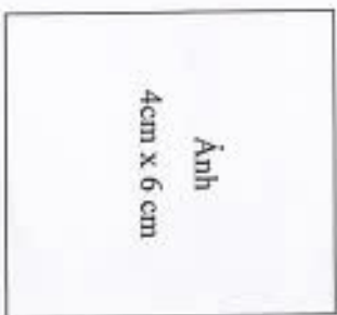
Ảnh 4cm x 6 cm